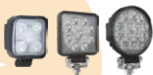
FARI DA LAVORO