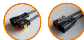
SOLUZIONI CUSTOM CON CONNETTORI