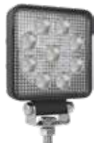
LWL 18W 9LED