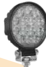
LWL 28W 14LED