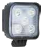
LWL 10W 5LED