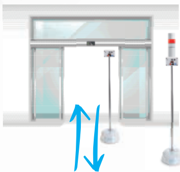
Accesso a singola porta